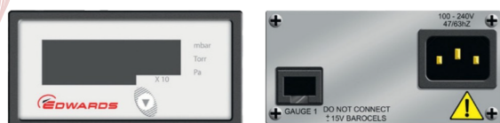
ADC コントローラー 1 ヘッド