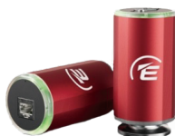
WRG-S 真空計 WRG-S-NW25 WRG-S-DN40CF