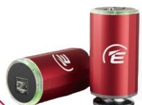
WRG200 真空計 WRG200-X-NW25 WRG200-X-DN40CF